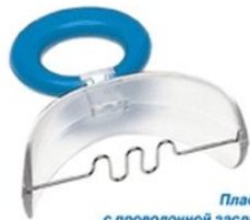
Пластинка с проволочной заслонкой: при открытом прикусе и инфантильном глотании