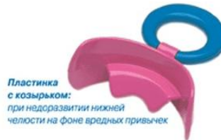
Пластинка с козырьком: при недоразвитии нижней челюсти на фоне вредных привычек