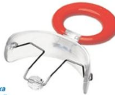
Пластинка с бусинкой: при неправильном положении языка и проблемах с речью