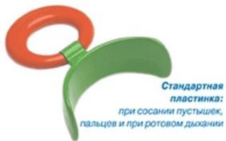
Стандартная пластинка: при сосании пустышек, пальцев и при ротовом дыхании

Это мягкие или твёрдые силиконовые тренажёры помогают восстановить носовое дыхание, а также корректируют положение языка, способствуют нормализации мышечного тонуса и помогают исправить прикус. Пластины носят от 5 минут до 1 часа днём, иногда и ночью.