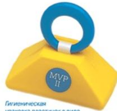
Гигиеническая упаковка пластинок в виде яркого сундучка нравится детям